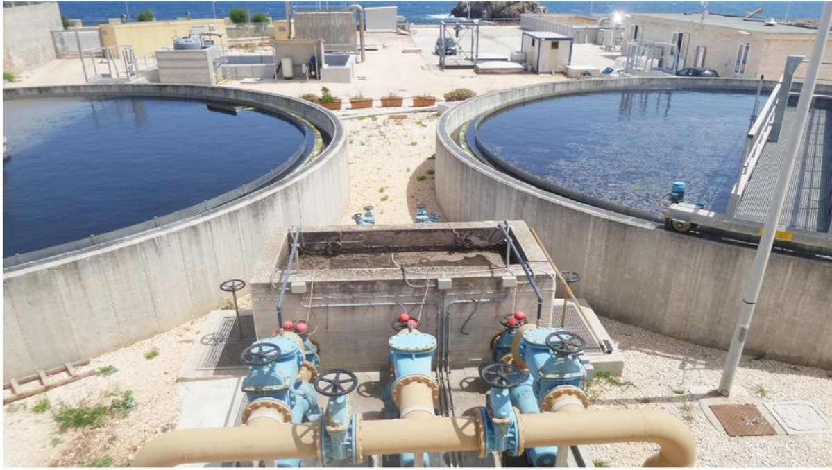
Impianto di depurazione di Polignano a Mare