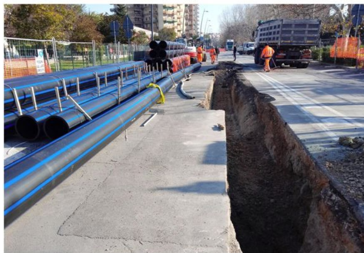
Lavori sulla rete idrica

Acquedotto Pugliese è una delle più grandi, storiche società italiane e tra i maggiori player europei, per dimensioni e complessità, nella gestione di sistemi idrici integrati. Da oltre cento anni a servizio del territorio, AQP gestisce il servizio idrico integrato in tutti i Comuni della Puglia e in 12 Comuni della Campania, per un totale di oltre 4 milioni di abitanti, su una superficie di 20 mila chilometri quadrati. Del gruppo fa parte la controllata ASECO SpA, azienda leader nel compostaggio. Una grande impresa pubblica, interamente controllata dalla Regione Puglia, con un organico di circa 2.000 dipendenti. Complessivamente le reti idriche gestite da AQP si sviluppano per 20 mila chilometri (di cui 5 mila per la sola adduzione), corredate da circa 1.500 opere tra serbatoi, partitori e impianti di sollevamento; a queste si aggiungono gli oltre 12 mila chilometri di reti fognarie con 700 opere di sollevamento a corredo. Acquedotto Pugliese gestisce anche 5 impianti di potabilizzazione ubicati in tre regioni (Puglia, Basilicata e Campania), 10 laboratori di analisi, 184 depuratori e 10 impianti d'affinamento per il riuso delle acque trattate. Numeri che testimoniano la dimensione e l'unicità di una grande azienda e di una delle più estese opere per la gestione integrata delle acque d'Europa.