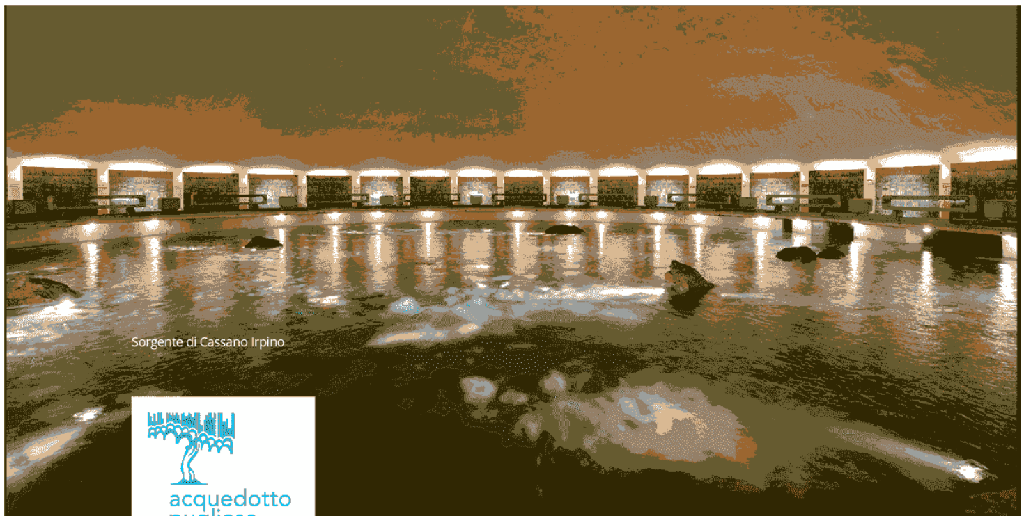
Sorgente di Cassano Irpino