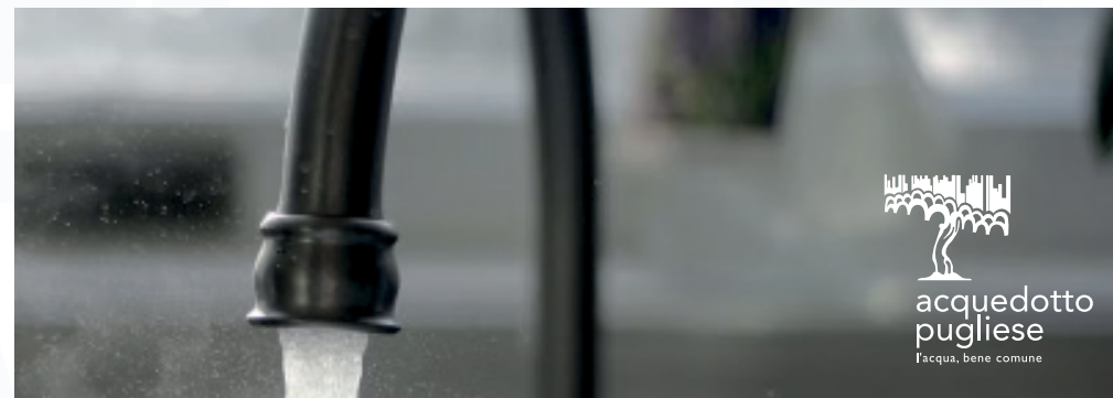
Immagini con sfondi scuri