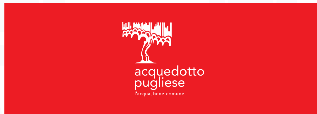
Sfondo con colore complementare al blu