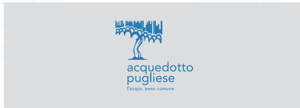
Sfondo grigio inferiore al 50% di nero