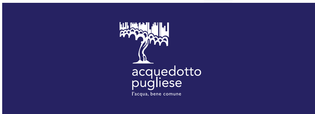
Sfondo con colori scuri