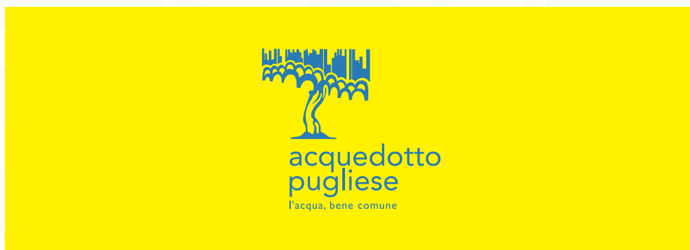
Sfondo con colore chiaro