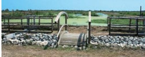
IL BIO-FITODEPURATORE DI MELENDUGNO

vo ad aspetti come la sicurezza e la qualità, anche considerando la natura dei servizi che gestisce. Si tratta, infatti, di infrastrutture che devono avere tempi di vita pari almeno a 50 anni e per le quali i risparmi ottenuti oggi a scapito della qualità si traducono domani in una crescita esponenziale dei costi. Pertanto, nella quasi totalità delle gare la nostra politica è quella dell'offerta economicamente vantaggiosa, ovvero della valutazione del giusto rapporto qualità/costo, non del massimo ribasso. Questa politica, non riguarda solo le gare per l'assegnazione dei lavori, ma anche le forniture di materiali e prodotti, salvo alcuni tradizionali. Inoltre, presso la nostra sede disponiamo di un laboratorio di prova molto attrezzato nel quale ogni singolo manufatto, tubazione, valvola, contatore che sia, viene accuratamente testato prima di essere installato su reti e impianti. È un'ulteriore verifica che conduciamo per avere le massime garanzie sull'affidabilità e la sicurezza sui materiali e i prodotti che utilizziamo, oltre ad una precauzione indispensabile per evitare spiacevoli sorprese una volta conclusi i lavori.