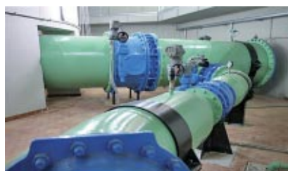
L'ACQUEDOTTO DEL LOCONE

Il nuovo acquedotto del Locone, per un investimento di 42 milioni di euro, collega l'omonimo potabilizzatore al sistema di alimentazione urbana di Barletta. Si sviluppa lungo un percorso di 38 km, interamente in acciaio e, con un diametro massimo di 1,6 metri, vanta una capacità di erogazione con picchi di 1.500 litri al secondo. A tali opere si aggiungono i lavori per il raddoppio del Sifone Leccese, la sostituzione della condotta "Sgolgore" a servizio degli abitati di Altamura e Gravina, la regolarizzazione della Andria-Bari e il progetto straordinario di risanamento delle reti.