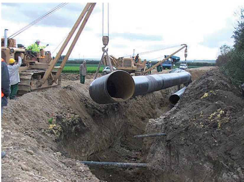
LAVORI DELL'ACQUEDOTTO DEL LOCONO

Il piano viene definito sulla base delle priorità, quindi prevedendo in primo luogo quegli interventi che permettono di sanare le situazioni più critiche. Al tempo stesso, cerchiamo di andare oltre il contingen-