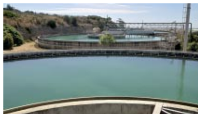
L'IMPIANTO DI POTABILIZZAZIONE DI CONZA

L'opera di sviluppo della rete continua con il potenziamento dello schema idrico del Sinni, in particolare con la costruzione del potabilizzatore di Conza (Campania). Un'opera da 53 milioni di euro in grado di trattare 1.500 litri al secondo.