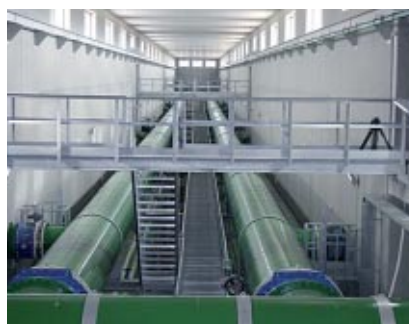
IL SERBATOIO DI MARZAGAGLIA

Il raddoppio del serbatoio di Marzagaglia ha permesso di accrescere la capacità di accumulo fino a circa 200.000 metri cubi di acqua, ottimizzando il funzionamento dell'intero sistema acquedottistico di interconnessione tra lo schema del Pertusillo-Sinni e il canale principale. L'ampliamento del serbatoio, per un investimento di 24,2 milioni di euro, consente una più efficiente gestione del servizio idrico in tutta la Puglia centro meridionale.