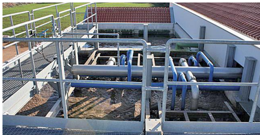
DEPURATORE DI NOCI